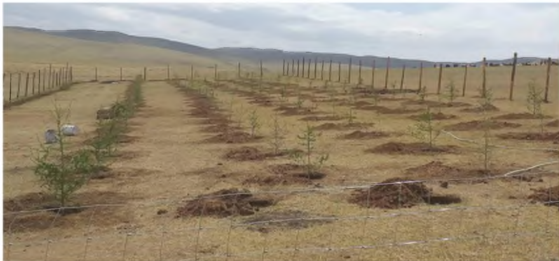
“ӨВ-АЗЗА” ТӨХКомпаний нийгмийн хариуцлагын хүрээнд “Алтан шар зам” хөшөөний дэргэд цэцэрлэгт хүрээлэнг Бүрд сумын Шарлингийн орчим байгуулж, 1000 ш улиас мод тарьжээ.

Улсын төсвөөр гүйцэтгэх газрын доройтол, цөлжилтөөс сэргийлэх хөтөлбөрийн хүрээнд Өвөрхангай аймгийн Баруунбаян-Улаан суманд хамгаалалтын ойн зурвас байгуулах” ажлын гүйцэтгэгчээр “Их сумт хайрхан” ХХКомпани шалгарч 8 га талбайд хамгаалалтын ойн зурвас байгуулж, 3500 ширхэг мод бут тарьсан байна.