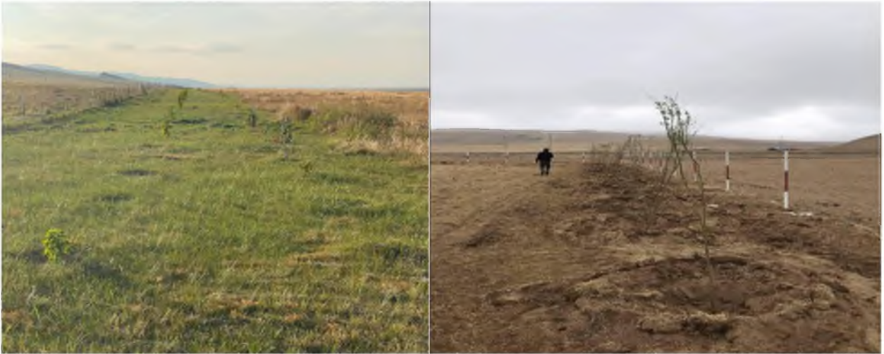
Хархорин суманд газар тариалан эрхэлдэг 16 аж ахуйн нэгж 10 га талбайд хамгаалалтын ойн зурвас байгуулж, 16 мянган ширхэг мод, тарьсан байдал