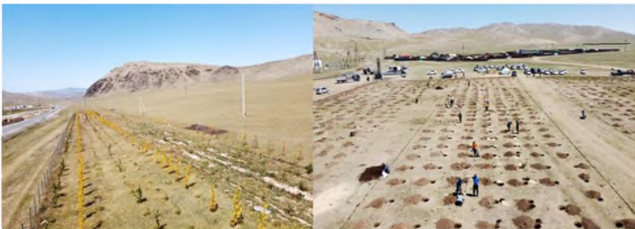
Хужирт сумын Рашаан сувилалын орчим “Жем-Хужирт” ХХК, Хужирт рашаан сувилал ХХК 800 метр ойн зурвас, байгуулсан байдал

Арвайхээр, Хужирт, Хархорин, Бүрд сумдад улсын чанартай авто зам дагуу мод тарих ажлыг эхлүүлж, Арвайхээр суманд А301 авто замын дагуу Хурд колонк, Зэвсэгт хүчний 0256 дугаар ангийн орчим 2.5 км урт, 15 метр өргөнтэй хамгаалалтын хашаа барьж 3400 ширхэг мод, Хужирт сумын Рашаан сувилалын орчим “Жем-Хужирт” ХХК, Хужирт рашаан сувилал ХХК 800 метр ойн зурвас, “ӨВ-А33А” ТӨХКомпани нь Бүрд сумын Шарлинд “Алтан шар зам” хөшөөний дэргэд цэцэрлэгт хүрээлэн байгуулж 1000 ширхэг мод тарьж усалгаанд зориулж сумаас 10,0 сая төгрөгөөр худаг гаргуулсан байна.