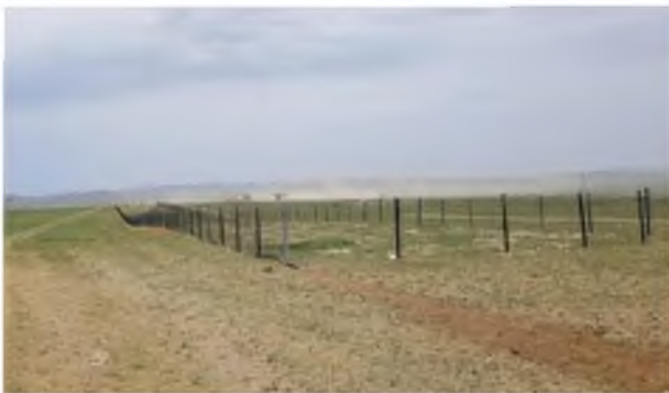
Хурд колонк 2237,2 метр газар

Байгаль орчныг хамгаалах, нөхөн сэргээх арга хэмжээний зардлаар Арвайхээр сумын нийтийн эзэмшлийн талбай, Цэргийн анги, УБ-Арвайхээрийн авто замын дагуу мод тарих 4 хэсэг талбайд 6300 уртааш метр хамгаалалтын хашаа барьж, уг ажилд 75.6 сая төгрөгийн санхүүжилт олголоо.