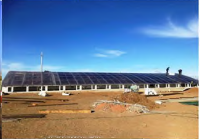
“Арвайхээр-Цэцэрлэгжилт” ОНӨААТҮГ газрын мод үржүүлгийн талбай