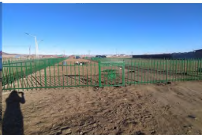
Уянга сумын “Өгөөмөр өргөө” ХХК, “Баярсгоулд” ХХК-иуд нийгмийн хариуцлагын хүрээнд сумын ногоон байгууламжийн хашаа хийсэн байдал