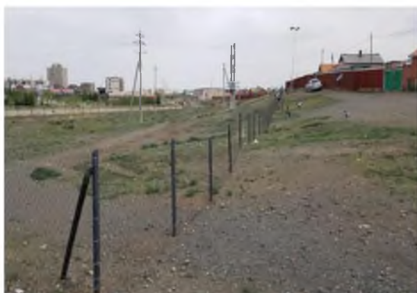
Дэлгэрэх 404,2 метр газар