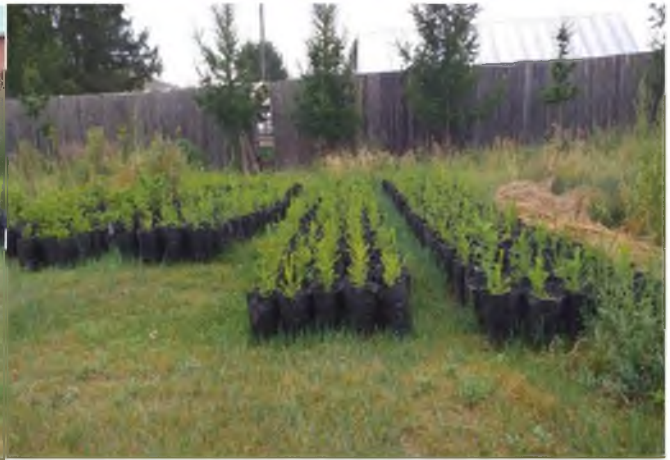
Мод үржүүлгийн газрын өргөтгөл