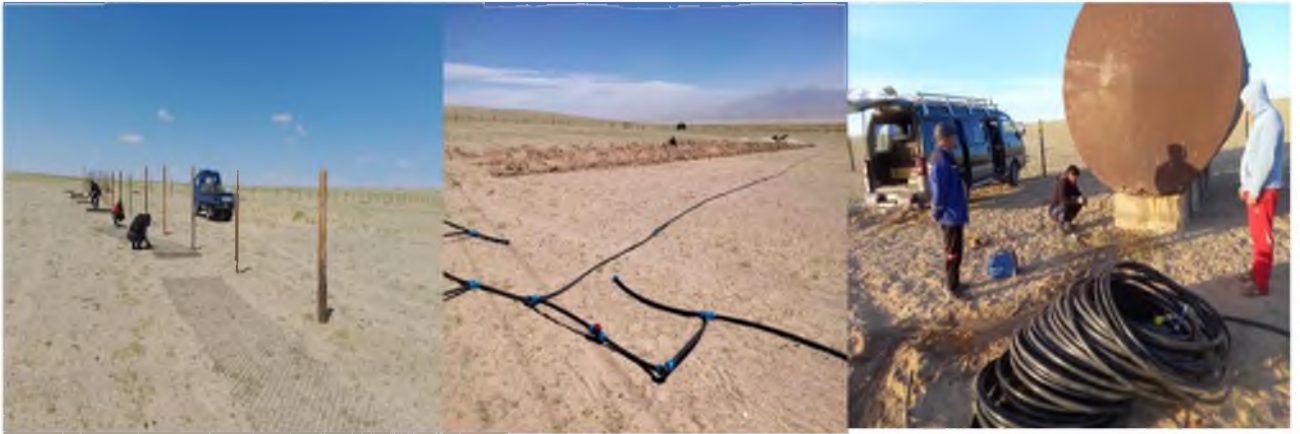
Хамгаалалтын ойн зурвас байгуулах ажил