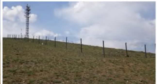
Өлзийт овоо 554,6 метр газар