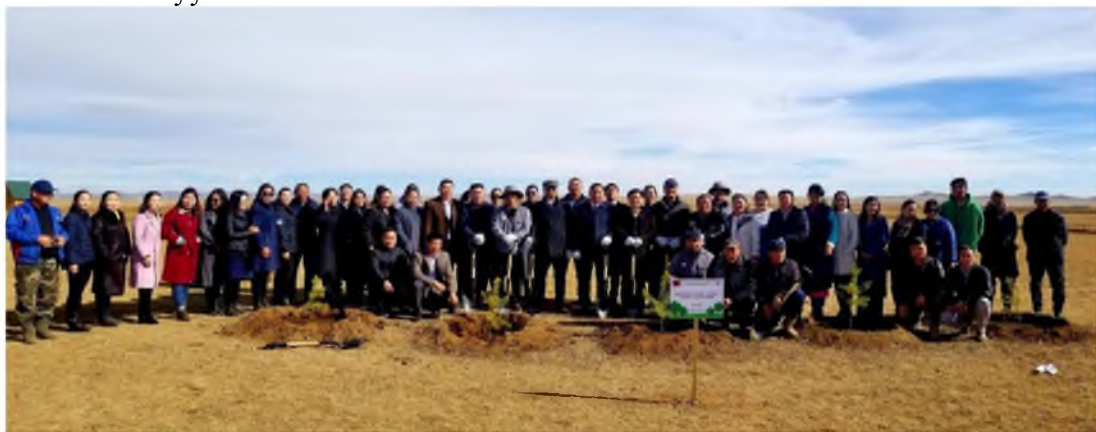
Тарьц суулгацны үзэсгэлэн худалдаа: