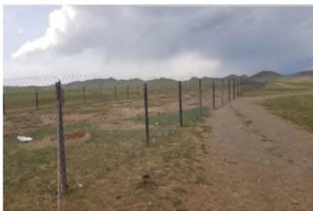
Цэргийн анги 3104 метр газар

Хашааны шонг “Арвайхээр тохижилт үйлчилгээ” ОНӨААТҮГазрын хаягдал хуванцараар хийсэн шонгоор хийсэн бол 12 га талбай бүхий Их монгол цэцэрлэгт хүрээлэнд ус хэмнэх дуслын усалгааны систем авч ашиглахаар боллоо.