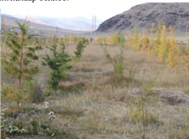
Хужирт сум ногоон байгууламжаа хашаажуулсан байдал: